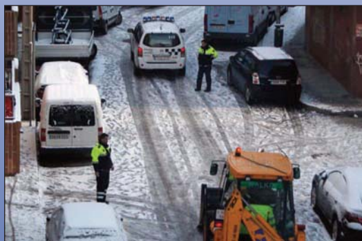
Imagen de la última nevada en Las Rozas.

La Concejalía de Servicios a la Ciudad dispone de más de 100 toneladas de sal almacenadas en diferentes instalaciones. En los días previos a las nevadas se suministra sal en sacos a los colegios, edificios municipales, centros de salud y centros de mayores. Igualmente se almacena una parte para emergencias en el Punto Limpio del Abajón, el Punto Limpio de Aristóteles y otras dependencias. El Ayuntamiento se encargaría de abastecer a las urbanizaciones en caso de urgencia, aunque es responsabilidad de cada propietario tener su propia sal en estos casos.