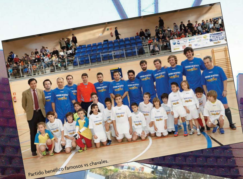
Partido benéfico famosos vs chavales.