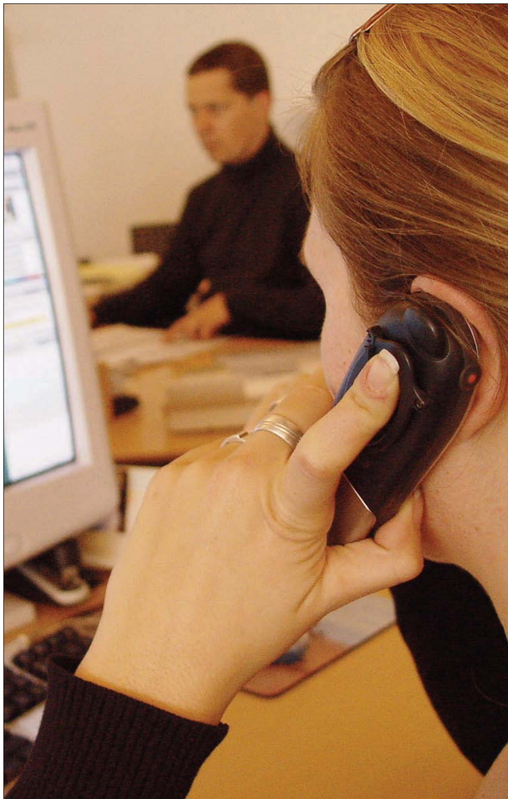
El servicio funciona las 24 horas del día.

Durante el año 2012, las consultas relacionadas con niños de hasta 9 años han concentrado el 89% de las llamadas atendidas, el 85% de las cuales tenía que ver con temas médicos. Dentro de este capítulo, las consultas más frecuentes fueron las relacionadas con otorrinolaringología (56,2%) y medicina general (32,1%). La mayoría de las llamadas (44,5%) se producen en la franja horaria que va de las tres de la tarde a las diez de la noche.