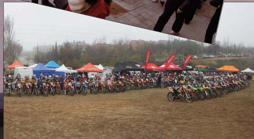
San Silvestre Endurera.