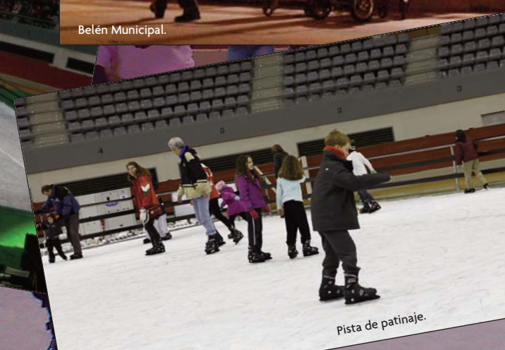
Pista de patinaje.