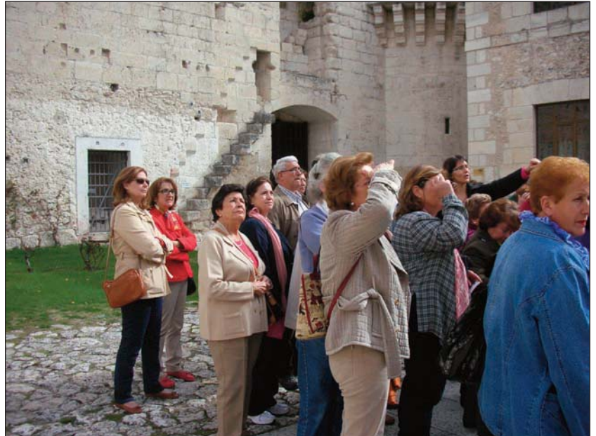
Los viajes incluyen visitas culturales.

Los viajes se desarrollan en las mejores condiciones y con todas las garantías, en colaboración con una agencia de dilatada experien-