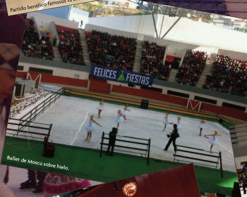
Ballet de Moscú sobre hielo.