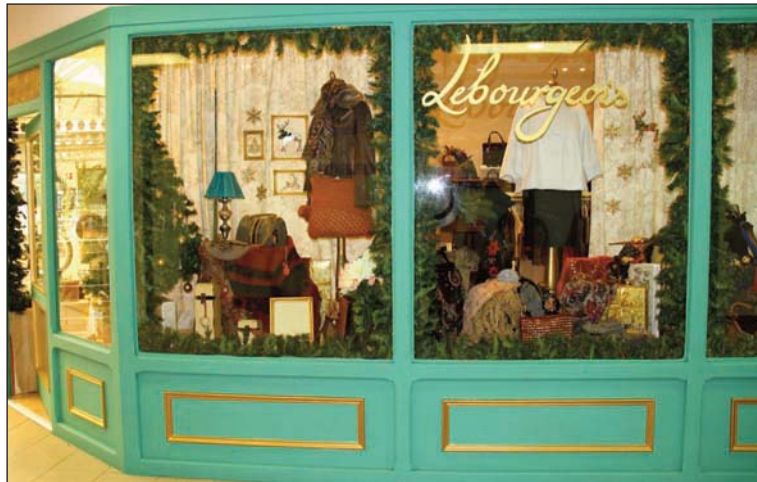
Escaparate ganador del concurso.

El comercio de moda y complementos “Lebourgeois”, situado en el Centro Comercial La Tortuga, consiguió el primer premio del 4º Concurso de Escaparates Navideños, organizado por la Concejalía de Economía, Empleo y Consumo en colaboración con la Cámara de Comercio e Industria de Madrid. El segundo premio fue para “Rincón Goloso”, un establecimiento del Zoco de Las Rozas, dedicado a la fabricación de repostería artesanal, que ya se impuso el año pasado y que ha vuelto a situarse entre los establecimientos que más cuidan su aspecto hacia el exterior. Completa el trío destacado “The First Outlet”, una tienda de moda ubicada en Európolis.