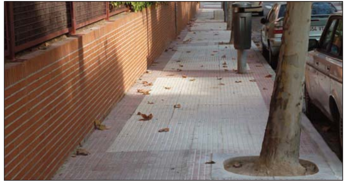
Acera en la zona de los Castillos.

En la avenida de Atenas las aceras, construidas con lajas de pizarra, estaban levantadas en numerosos puntos, lo que hacía imposible la circulación peatonal. Para paliarlo, se han sustituido por 350 metros lineales de acera de hormigón con fibras de polipropileno. En las calles Rosa de Lima y Formentera, lo que se ha hecho es construir acera