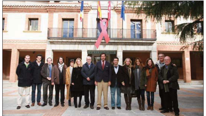
Miembros de la Corporación.

El Día Mundial de la Lucha contra el Sida se conmemora cada 1 de diciembre desde 1988 con el objetivo de generar una mayor conciencia de lo que supone esta pandemia e impulsar avances en materia de prevención, tratamiento y atención a los afectados. El reto actual es avanzar en la normalización de las personas que viven con el VIH, continuar investigando para hallar una cura, evitar nuevas infecciones y lograr