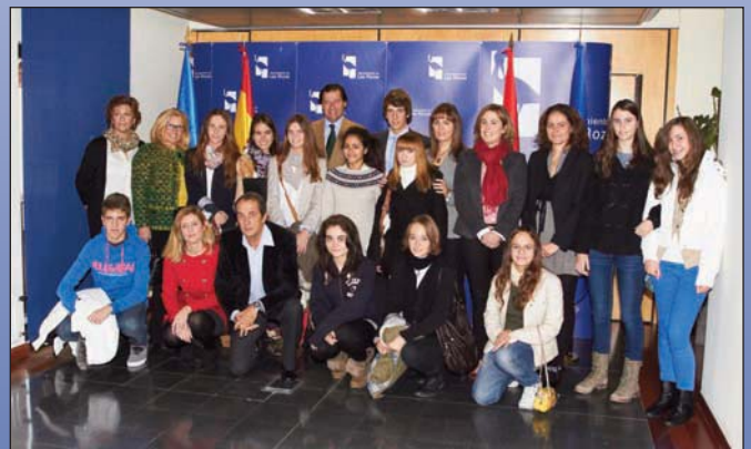
“Socios por un día” forma parte del programa “Profesionales desde la escuela”.

Fundación Junior Achievement que a lo largo de este curso ofrece a los alumnos de 15 centros educativos públicos, concertados y privados de Las Rozas vivir la realidad laboral de una treintena de empresas punteras y compartir experiencias y conocimientos con los trabajadores y directivos de las mismas.