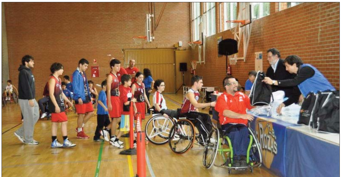
Imagen de la entrega de trofeos.