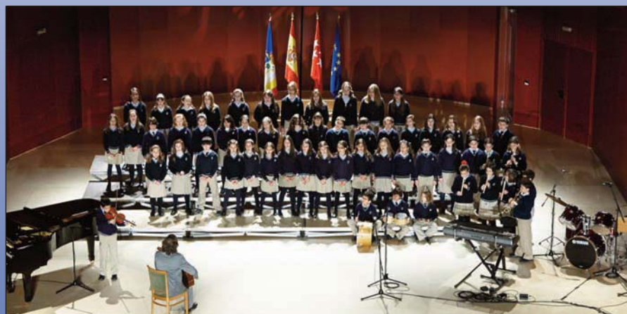
El Certamen contó con la participación de 29 centros escolares.

Dada la cantidad de participantes, una vez más la exhibición se tuvo que dividir en dos jornadas. En esta edición participaron los centros El Cantizal, Los Jarales, Orvalle, Berriz, Zola, Santa María