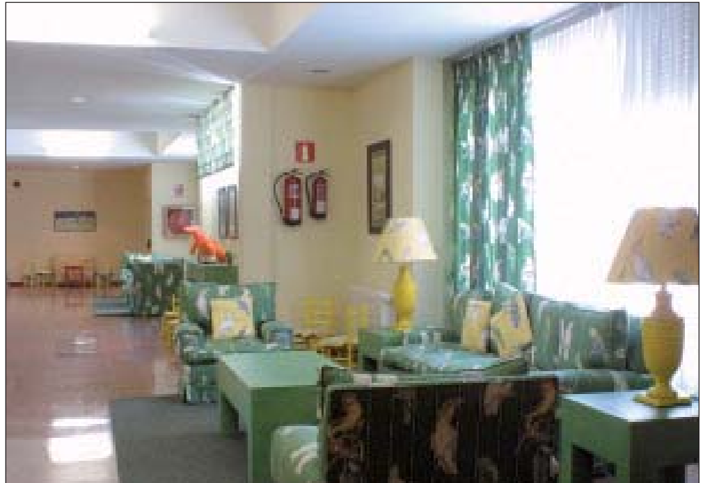
Imagen de la Residencia Oncológica Infantil de la AECC.

La Asociación realiza programas dirigidos a ofrecer la ayuda necesaria para que no exista ninguna persona afectada de cáncer que se sienta sola o desatendida. Además, informa y concientiza sobre la prevención de la enfermedad y fomenta la investigación oncológica, financiando importantes proyectos a través de la Fundación Científica de la AECC, que actualmente es la entidad privada que más fondos destina a la investigación.