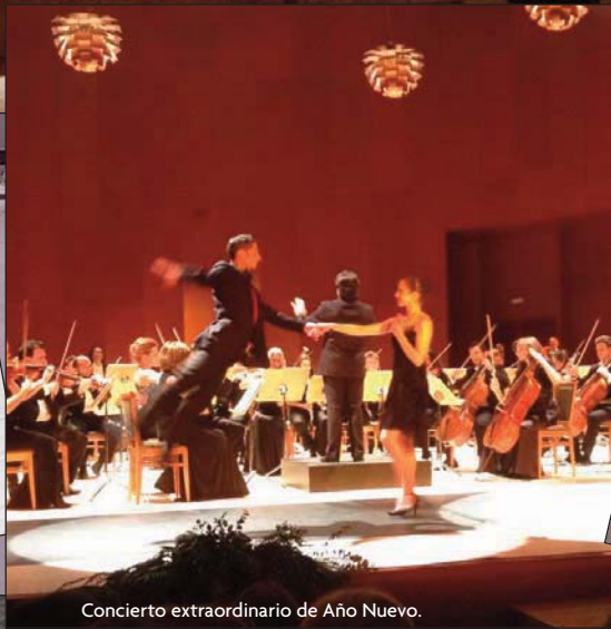
Concierto extraordinario de Año Nuevo.