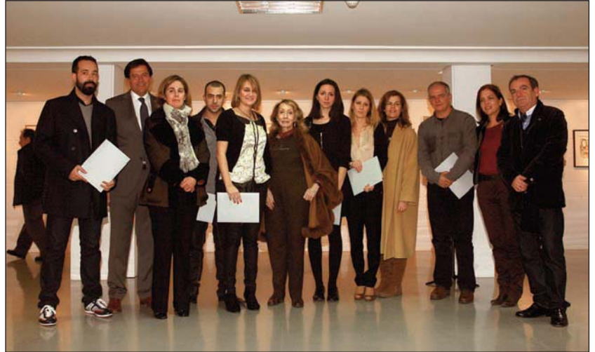
En la imagen, los ganadores del Certamen.