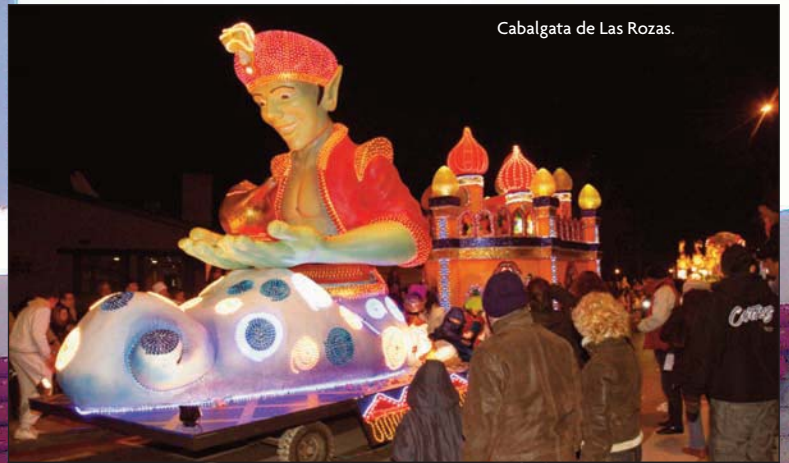
Cabalgata de Las Rozas.