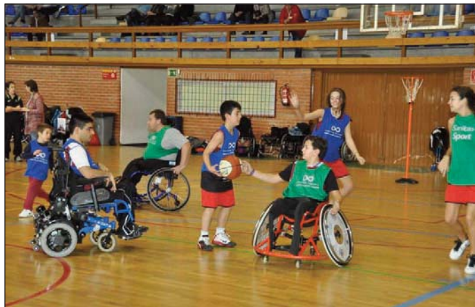
El torneo contó con la participación de cerca de 100 jugadores.