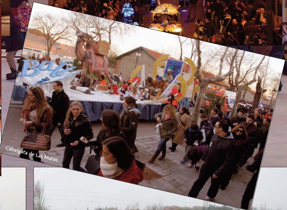
Cabalgata de Las Matas.