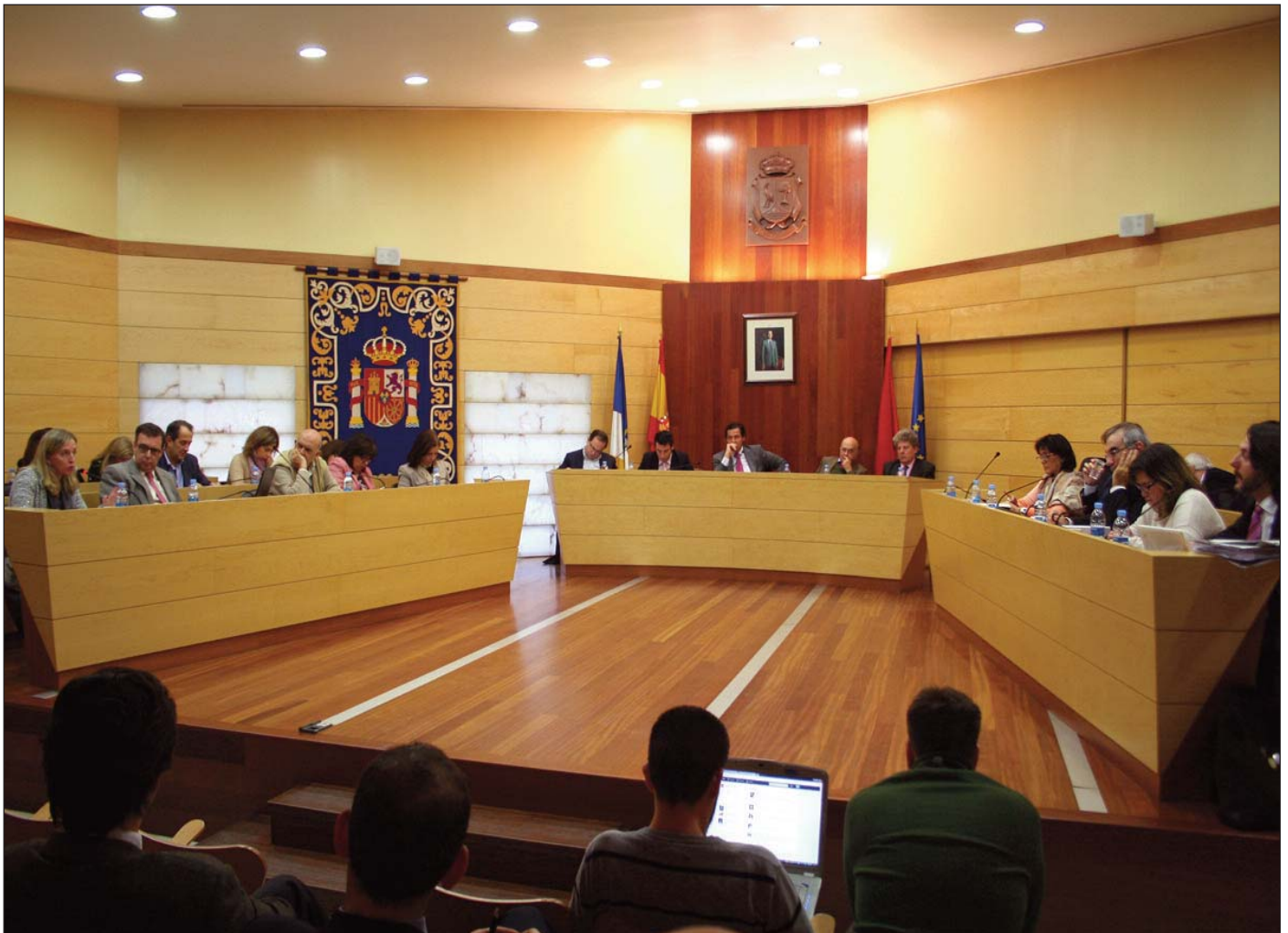
Un momento de la sesión plenaria.

El pasado 28 de diciembre, el Pleno del Ayuntamiento aprobó de manera inicial, con los votos en contra de PSOE, UPyD e IU-LV, los Presupuestos Municipales para 2013, que ascienden a 99.047.880 euros. Esta cifra supone un 10% menos que en 2012, un descenso que consolida la política de reducción de gastos en materia de personal y en otras partidas que no afectan a servicios esenciales. A pesar de esta reducción, se mantienen e incluso crecen los gastos en servicios al ciudadano.