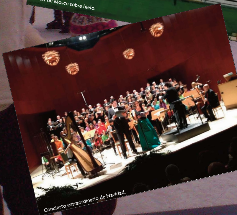
Concierto extraordinario de Navidad.